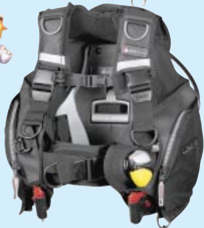
MARES PEGASUS AIRTRIM € 475..