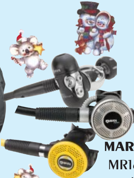
MARES MR16 Epos mit Okto AXIS € 340..