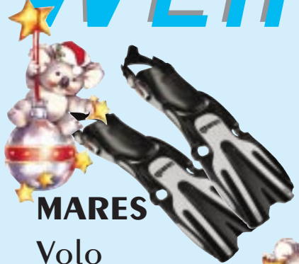
MARES Volo € 99..