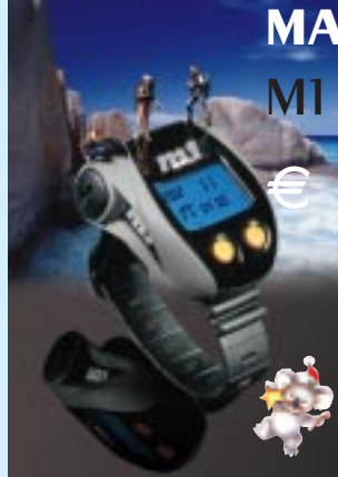
MARES MI COMPUTER € 299..