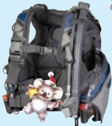
MARES VECTOR PLATINUM MRS € 390..